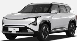
BLANCO SNOW (SWP)