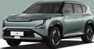
VERDE ICEBERG (IEB)*