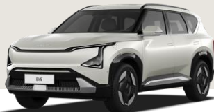
PLATA MARFIL MATE (ISM)