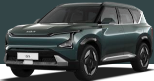
AZUL ÁRTICO (OVA)*