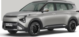
PLATA MARFIL (ISG)