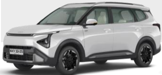
BLANCO INVIERNO (UD)