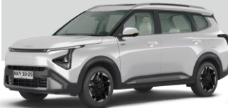
PLATA RESPLANDECIENTE (KDS)