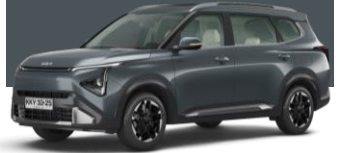
GRIS GRAVEDAD (KDG)