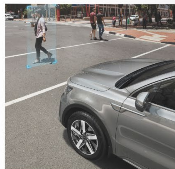
Sensores de proximidad delanteros y traseros.