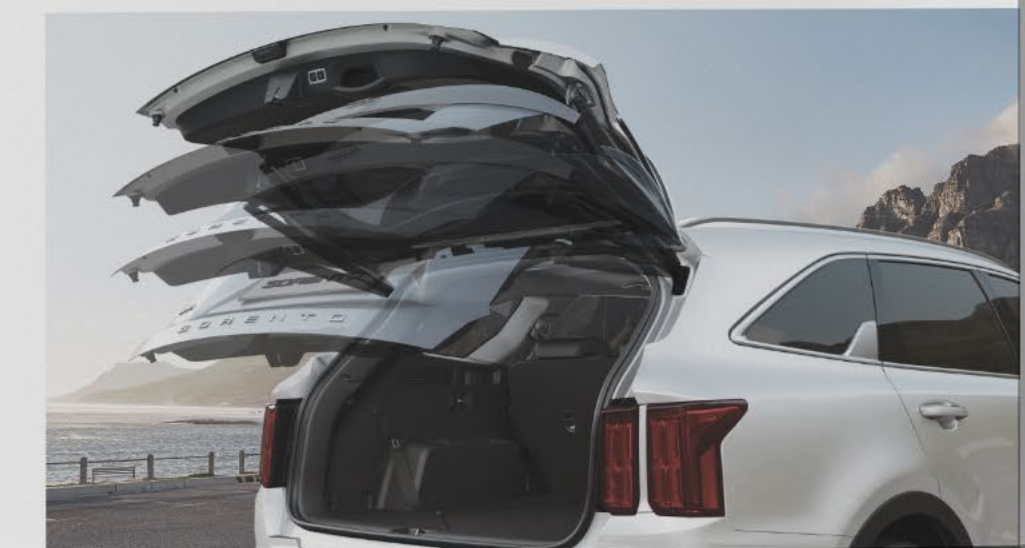
Puerta trasera eléctrica inteligente.