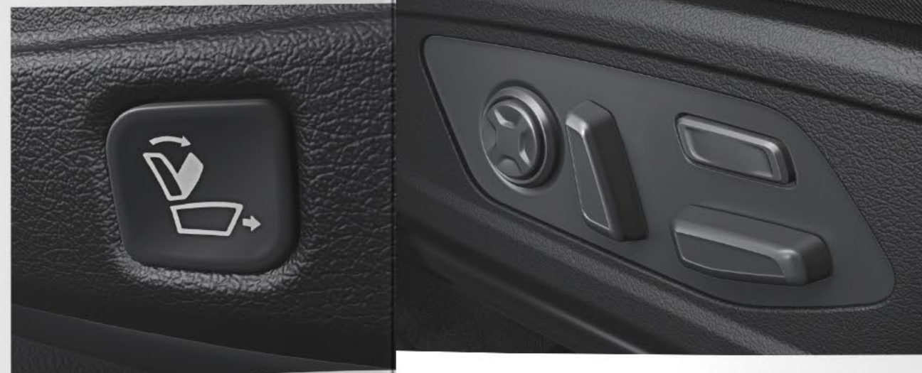
Asientos delanteros eléctricos*.